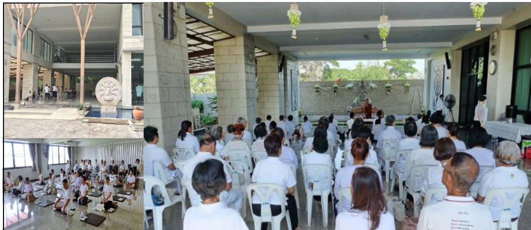
โครงการจิตอาสาธรรมบรืกรหลักสูตรปฏิบัติธรรมสำหรับผู้สูงวัย (ส.ว.)

โครงการ ส.ว. (จิตอาสาธรรมบรืกรหลักสูตรปฏิบัติธรรมสำหรับผู้สูงวัย ) เป็นโครงการที่บริษัทฯ จัดกิจกรรมขึ้นเพื่อส่งเสริมให้พนักงานมีจิตอาสาในการทำประโยชน์ต่อสังคม ช่วยเหลือผู้สูงอายุ และร่วมปฏิบัติธรรมกับผู้สูงอายุร่วมกับมูลนิธิธรรมาภิบาล กรุงเทพมหานคร โดยโครงการนี้เริ่มขึ้นในเดือนกันยายน ปี 2554 – จนถึงปัจจุบัน ซึ่งแต่ละเดือนจะผลัดเปลี่ยนหมุนเวียนพนักงานของแผนกต่างๆ ในการเป็นจิตอาสาหลักเข้าร่วมกิจกรรมนี้ ซึ่งในปัจจุบันก็ยังเปิดโอกาสให้พนักงานเข้าร่วมเป็นจิตอาสาธรรมบรืกร และเข้าร่วมปฏิบัติธรรมได้ตามความประสงค์ทุกเดือน