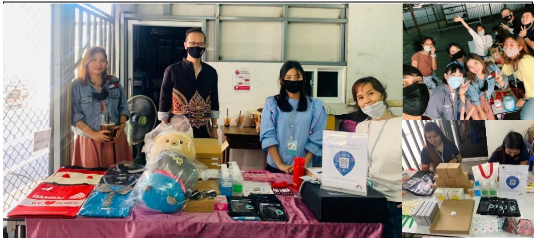
โครงการบริจาคโลหิตกับสมาคมชาดไทย